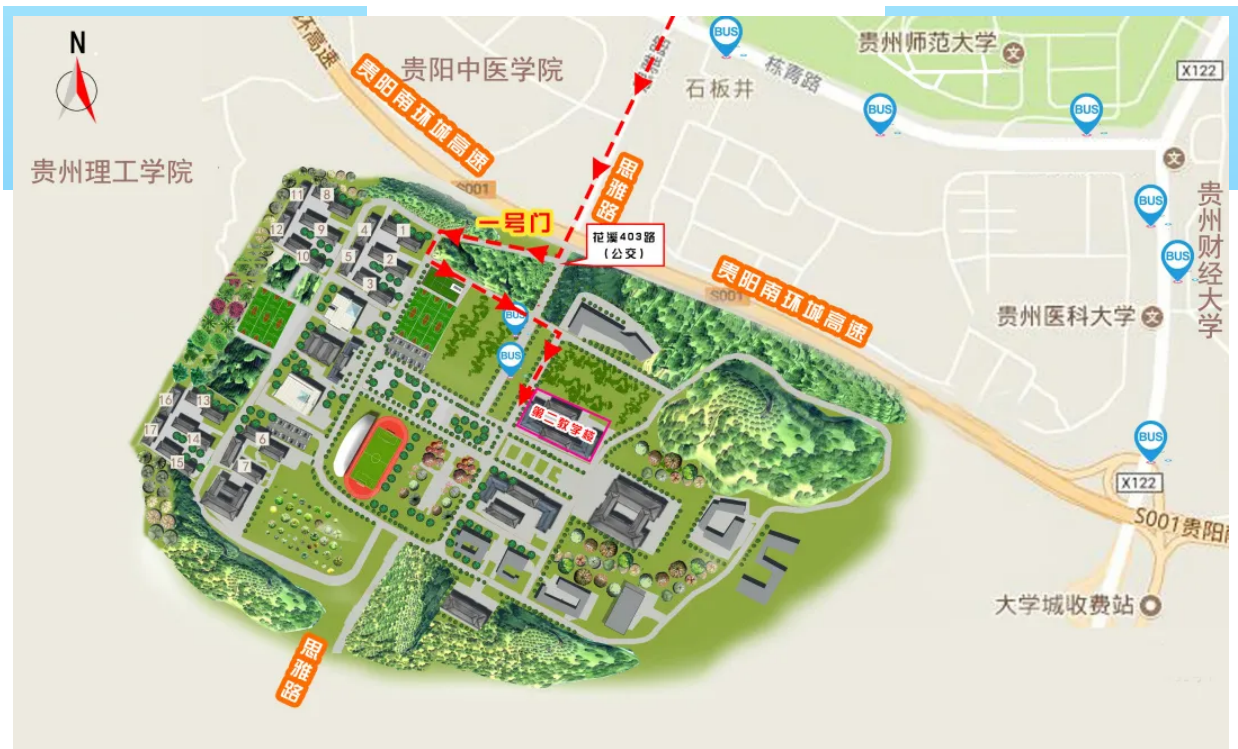
贵州民族大学考点路线图（点击图片放大）