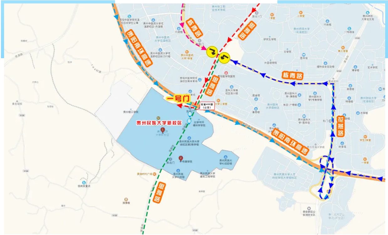
交通示意图（点击图片放大）